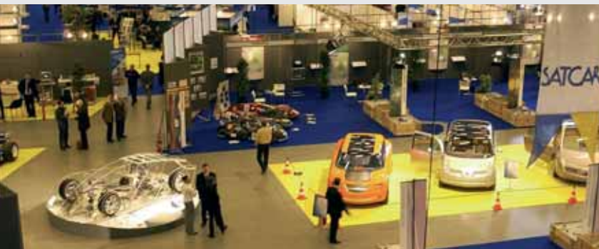
La Biennale européenne Satcar 2005, véritable vitrine des savoir-faire automobiles du Massif central.

pour notre cci, c'est déjà, entre autres :