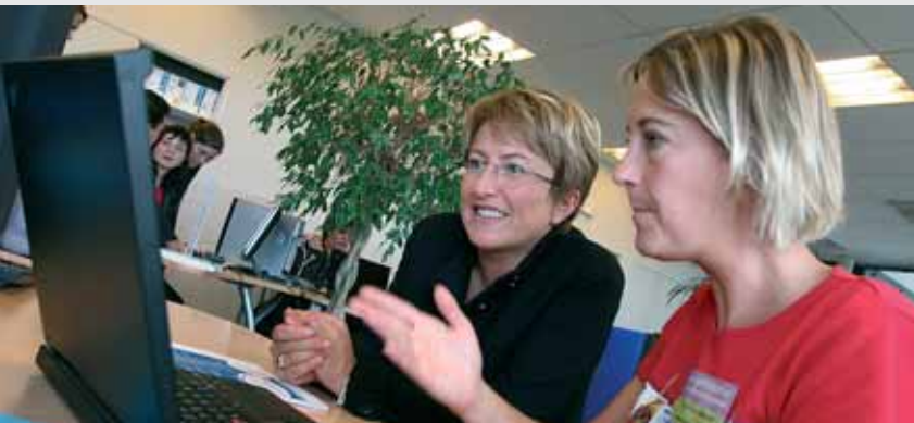
Premier forum de la e.administration en novembre 2005 au sein des locaux de Pratic.

pour notre cci, c'est déjà, entre autres :