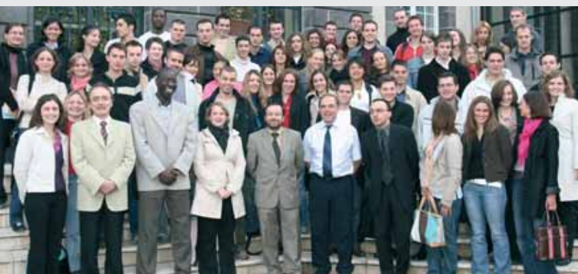
Rentrée 2005 des apprentis à l'ESC

pour notre cci, c'est déjà, entre autres :